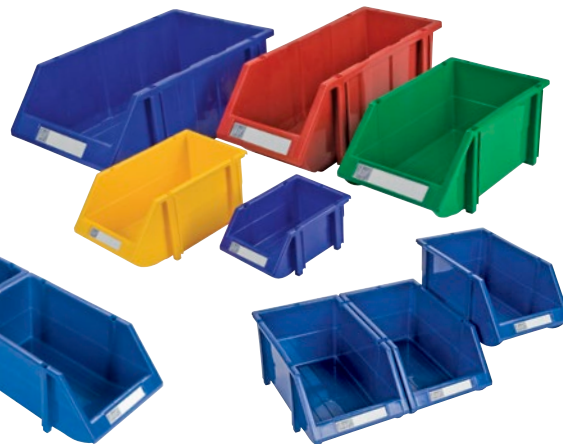
Pièces moulées pour faciliter l'assemblage côte à côte