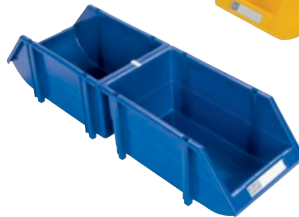
Une agrafe d'assemblage permet un montage dos à dos