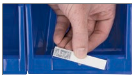
Plaque avant inclinée avec étiquette amovible recouverte de plastique protecteur