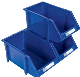
Empilables avec les pieds intégrés